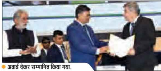
● अवार्ड देकर सम्मानित किया गया.

को सुरक्षित रखने वाली तकनीक का इस्तेमाल करते हुए संसाधनों के उपयोग और ऊर्जा क्षमता के कारण दिया गया है. कंपनी अपनी विस्तृत कार्यक्षमता के कारण इन लाभों को व्यापक स्तर तक पहुंचाने और उस प्रभावशाली कार्यक्षमता को ग्राहकों को अपने नवीन लाइन के उत्पादों के माध्यम तक पहुंचाने में सफल रही है.