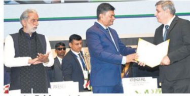
दर्शन रिपोर्ट » सुंदर

भारत की अग्रणी निजी लाइफ इंश्योरेंस कंपनी रिलायंस निप्पान लाइफ इंश्योरेंस को भारत के ऊर्जा मंत्रालय के ब्यूरो आफ एनर्जी एफिशिएंसी की ओर से नेशनल एनर्जी कंजर्वेशन अवार्ड (एनईसीए) 2023 दिया गया है। कंपनी को यह प्रतिष्ठित अवार्ड उसके द्वारा किए जा रहे पर्यावरण फ्रेंडली कार्यप्रणाली और सतत बिजनेस ग्रोथ में योगदान देने के लिए प्रदान किया गया है।